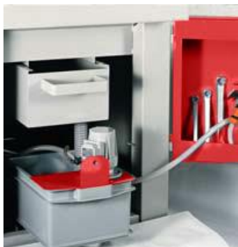
Bac à copeaux et système de lubrification