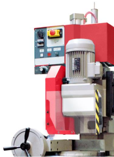
WS 315 SA (version semi-automatique)