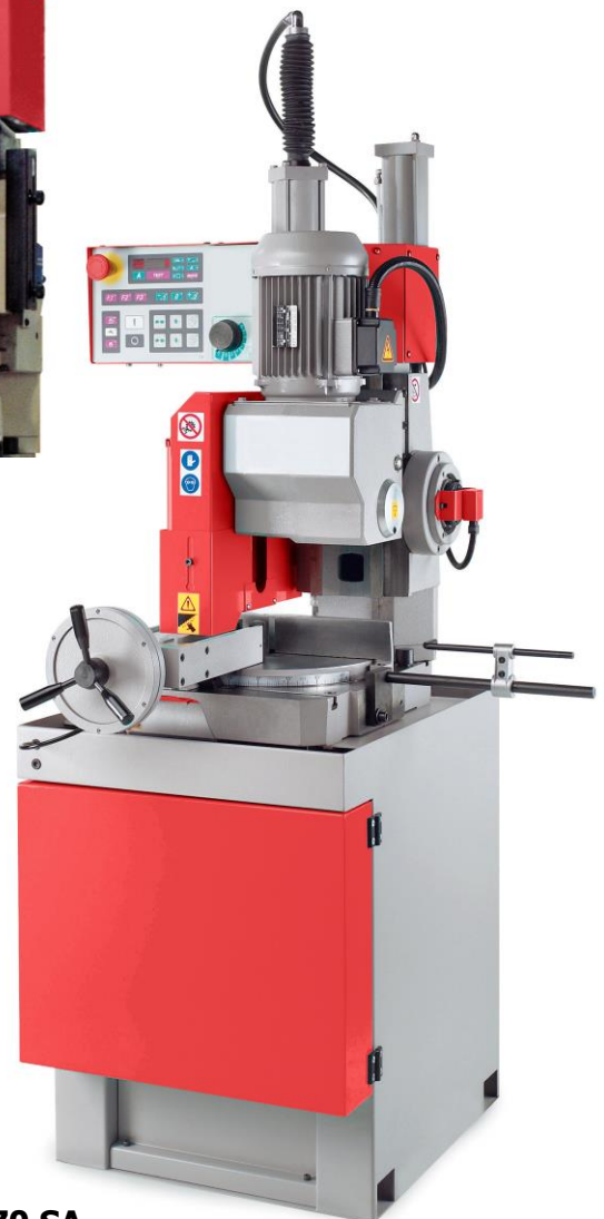
WS 370 SA (version semi-automatique)

Pour coupes droites et biaisées à 45° à droite et à gauche, et même jusqu'à 60° à droite.