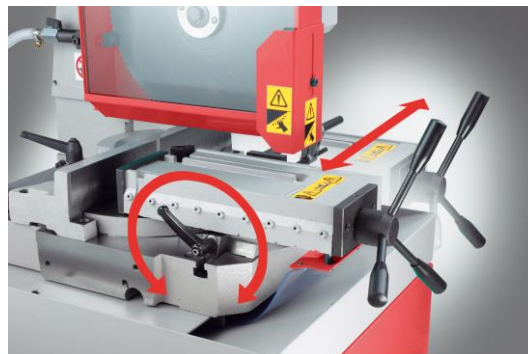
Etau horizontal avec mors double serrage