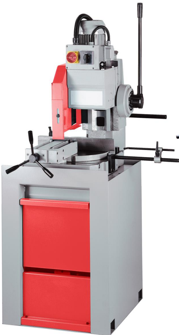
WS 315 M / WS 370 M (version manuelle)